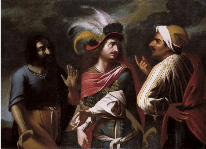
Scena di genere. L'agguato

Pittore italiano Seconda metà del XVII secolo